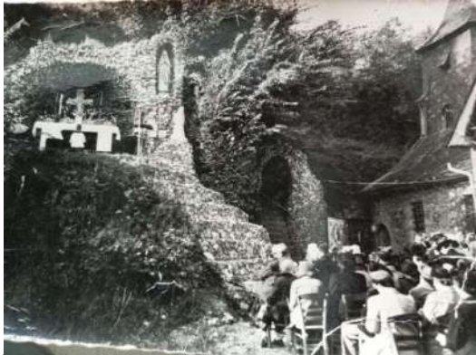
Devant la grotte, vers 1950

Il avait été décidé cette année pour rendre grâce à notre Bienheureuse Vierge Marie au mois de mai, de nous retrouver les 12, 19 et 26 à 18 heures à la grotte de Sainte Austreberthe pour y réciter le chapelet et célébrer la messe. Malheureusement, le 12 mai, la météo ne s'y prêtant guère, nous avons dû célébrer dans la petite chapelle de la source, qui ne manque pas de charme non plus. Les 19 et 26 mai le soleil nous ayant rejoint, Merci Sainte Vierge Marie, Nous avons pu réciter le chapelet puis célébrer la messe au pied de la grotte, comme cela se pratiquait jadis.