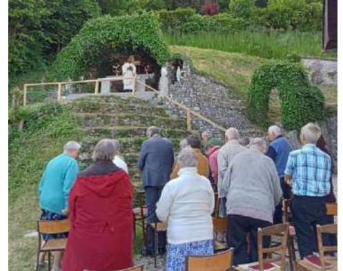
Devant la grotte, en mai 2023