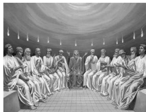
Descente de l'Esprit-Saint sur les Apôtres