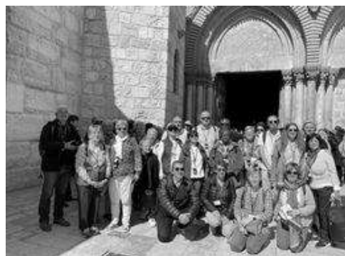
Pèlerins de Barentin et Pavilly devant la basilique du Saint Sépulcre à Jérusalem en 2023