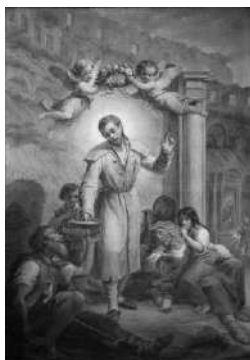
La charité de saint Benoît-Joseph Labre, tableau de l'église Sainte-Marie-des-monts.